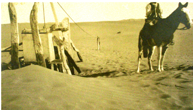
Imagen N° 2: Boca de jagüel, área de Emilio Mitre, 1920